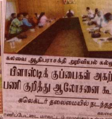
கலவை ஆதிபராசக்தி அறிவியல் கல்வி பிளாஸ்டிக் குப்பைகள் அகற்றும் பணி குறித்து ஆலோசனை கூடல் கலெக்டர் தலைமையில் நடந்தது