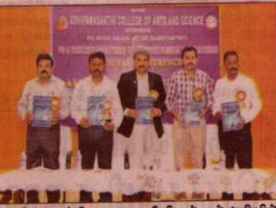
ஆதிபராசக்தி கலை அறிவியல் கல்லூரியில்