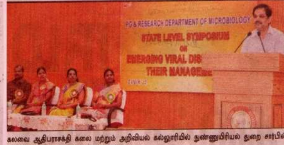
கலவை ஆதிபராசக்தி கலை மற்றும் அறிவியல் கல்லூரியில் துணை அறிவியல் துறை சார்பில் மாநில அளவிலான கருத்தரங்கம் நடந்தது.