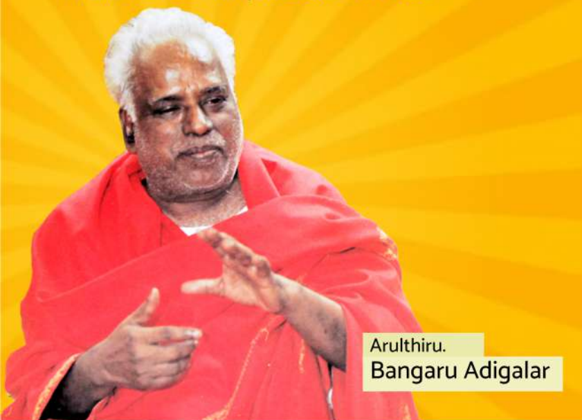
Arulthiru. Bangaru Adigalar